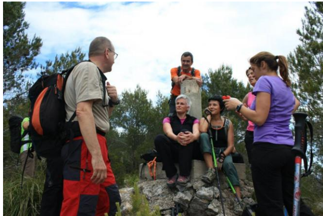
Un grupet de Kabretes al vèrtex fent discursos