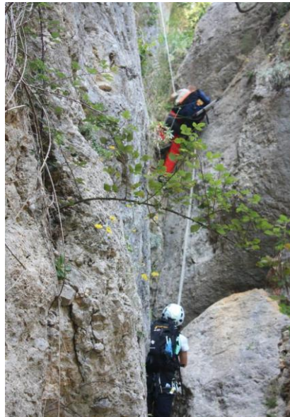
Na Marga mirant es kul a n'en Garrot

Es traca d'un Pas poc freqüentat, segurament perquè l'aproximació transcorre per un terreny molt poc amable. Tot i que el bot no va més enllà dels onze metres s'ha d'anar en compte per la seva verticalitat i la poca estabilitat del terreny a la sortida.