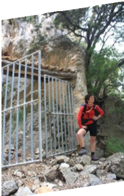
Au, amunt, amunt, Kabretes