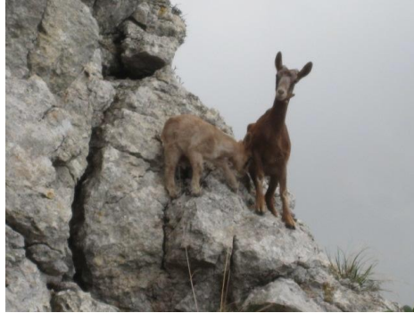
Una de kabretes a Alcadena davallant pel Pas de Sa Corda.

Es traca d'un Pas poc freqüentat, segurament perquè l'aproximació transcorre per un terreny molt poc amable. Tot i que el bot no va més enllà dels onze metres s'ha d'anar en compte per la seva verticalitat i la poca estabilitat del terreny a la sortida.