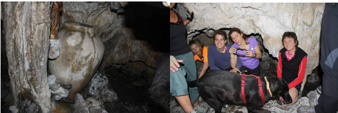
Ningú es va voler perdre la baixada a la cova de s'Alfàbia