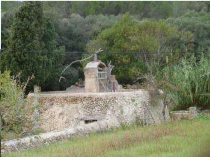
Es safareig de son Reus i una s'nia d'espectacular bellesa que podeu trobar un cop passat es puig de s'Escolà, ja quasi al final de l'excursió abans de voltar el camí de Ferrutzelles