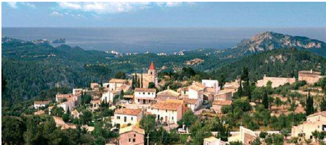
Imatge de Galilea , poble vigilant del mar...

Allà enfilàrem cap amunt, primer per l'asfalt, on s'ha d'anar molt alerta amb els cotxes i després un poc passat el tercer revolt agafàrem una dreuera que ens porta directament a dalt del poble a la zona de Rocassol . Allà aprofitarem la volta per anar a veure una antiga casa de neu que si bé està molt deixada de la mà de Déu és un important element etnològic de la zona.